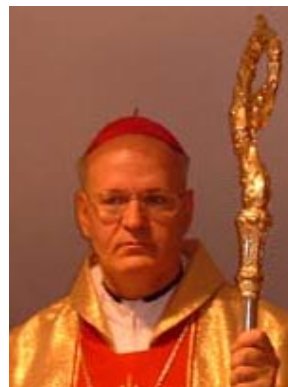
Kardinál Péter Erdő, najmladší kardinál, Budapešť