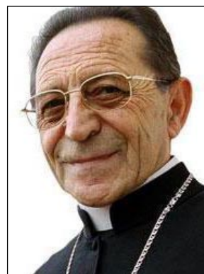
Kardinál Julian Herranz, predseda Pápežskej rady pre výklad legislatívnych textov, Rím