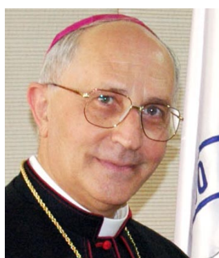
Fernando FILONI arcibiskup, substitút Prvej sekcie Štátneho sekretariátu (* 1946 Taliansko)