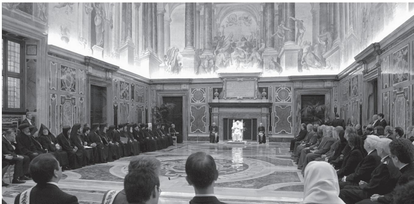
Pápež Benedikt XVI. počas príhovoru v Klementínskej sále vo Vatikáne. V tejto sále každoročne prijíma aj sudcov a ostatných pracovníkov Rímskej roty.