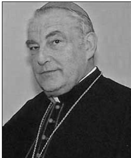
Kardinál Zenon Grocholewski, prefekt Kongregácie pre katolícku výchovu.

2. Zmluva medzi Svätou Stolicou a Slovenskou republikou je dokumentom, ktorý tvorí bázu, základ i rámec pastoračnej činnosti cirkvi na vysokých školách Slovenskej republiky. Táto skutočnosť sa nedá a nemôže ignorovať a nerešpektovať.