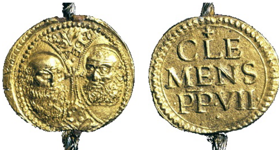
Rub a lic pečate pápeža Klementa VII. zo Zlatej buly, ktorou v roku 1524 oznámil Karolovi V. jeho cisársku korunováciu.

Ide o známy Ježišov výrok, vyjadrený v Matúšovom (Mt 22, 17) i v Lukášovom evanjeliu (Lk 20, 25). Ukazuje sa, že kresťanská tradícia vyjadrujúca vzťah cirkvi a štátu postavená na tomto výroku vniesla doň zdravú dualitu, vylučujúc nárok na absolútnu dominantnosť iba jedného právneho poriadku. Pre niektorých je táto dualita prijateľná, lebo vytvára určitý priestor slobody od jednej i druhej moci. Pre iných je však neprijateľné, aby na jednom a tom istom území, nad jedným a tým istým človekom vládol aj iný, než iba jeden právny poriadok. Zástancovia týchto postojov sú v obidvoch táboroch, náboženskom i svetskom. Čo Konštantín Veľký pochopil, že okrem svetenských zákonov existujú aj iné a že štátna moc nie je schopná človeka výlučne usmerňovať (milánsky edikt z roku 313), to začal kaziť Teodózius, ktorý z pozície štátnej autority naria-