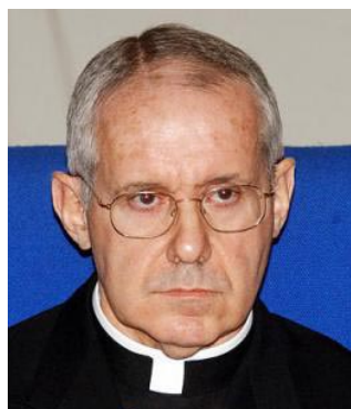
Jean-Louis Pierre TAURAN kardínál, predseda Pápežskej rady pre medzi- náboženský dialóg (* 1943 Francúzsko)