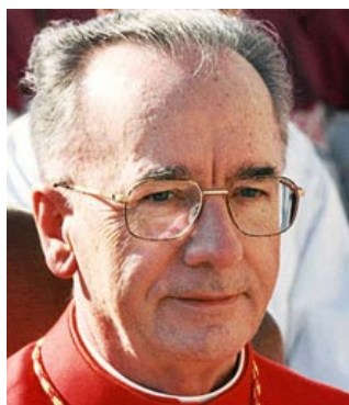
Cláudio HUMMES, OFM kardínál, prefekt Kongregácie pre klérus (* 1934 Brazília)