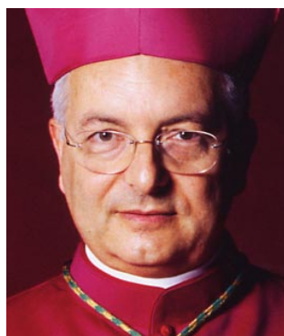
Mauro PIACENZA arcibiskup, sekretár Kongregácie pre klérus (* 1944 Taliansko)