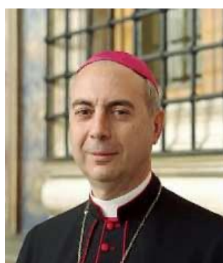
Dominique Francois Joseph MAMBERTI arcibiskup, substitút Druhej sekcie Štátneho sekretariátu (* 1952 Maroko)