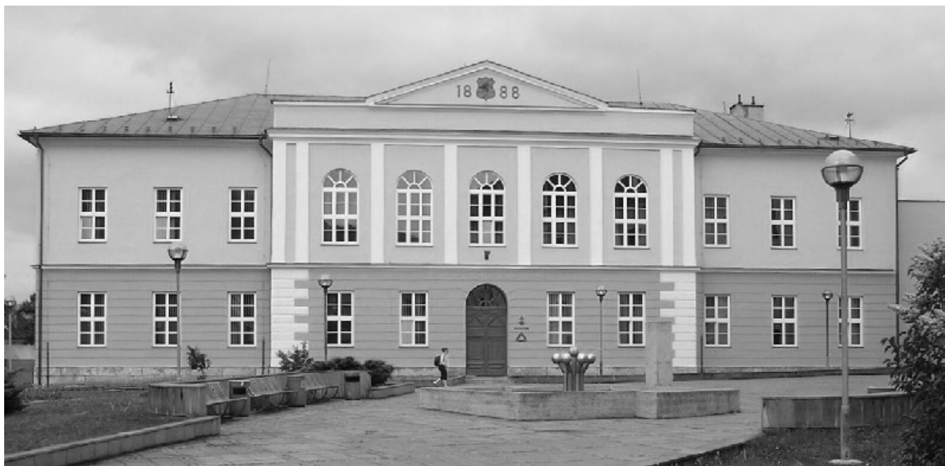
Rektorát Katolíckej univerzity v Ružomberku.