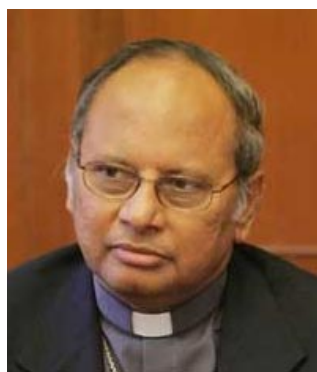
Albert Malcolm Ranjith PATABENDIGE DON arcibiskup, sekretár Kongregácie pre Boží kult a sviatosti (* 1938 Srí Lanka)