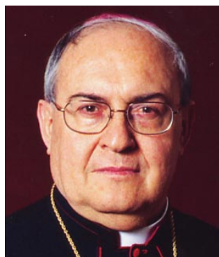
Leonardo SANDRI arcibiskup, prefekt Kongregácie pre východné cirkev (* 1943 Argentína)