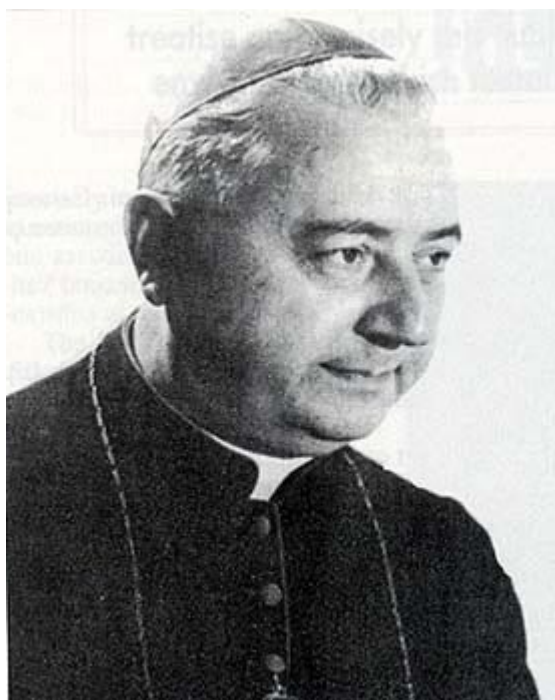
Arcibiskup Annibale Bugnini, CM (1912-1982), bývalý sekretár Kongregácie pre Boží kult a disciplínu sviatostí a „projektant“ pokoncilovej liturgickej reformy

V týchto dňoch sa opäť dostáva do popredia osobnosť arcibiskupa Annibala Bugniniho v súvislosti s apostolským listom Summorum Pontificum , ktorého normatíva vstúpi do platnosti na sviatok Povýšenia svätého Kríža (14. septembra) tohto roku. Arcibiskup Bugnini sa totiž považuje za „duchovného otca“ pokoncilovej liturgickej reformy pápeža Pavla VI. Ide o osobnosť, ktorú jedni vyzdvihujú, iní zatracujú. Kto bol v skutočnosti Annibale Bugnini?