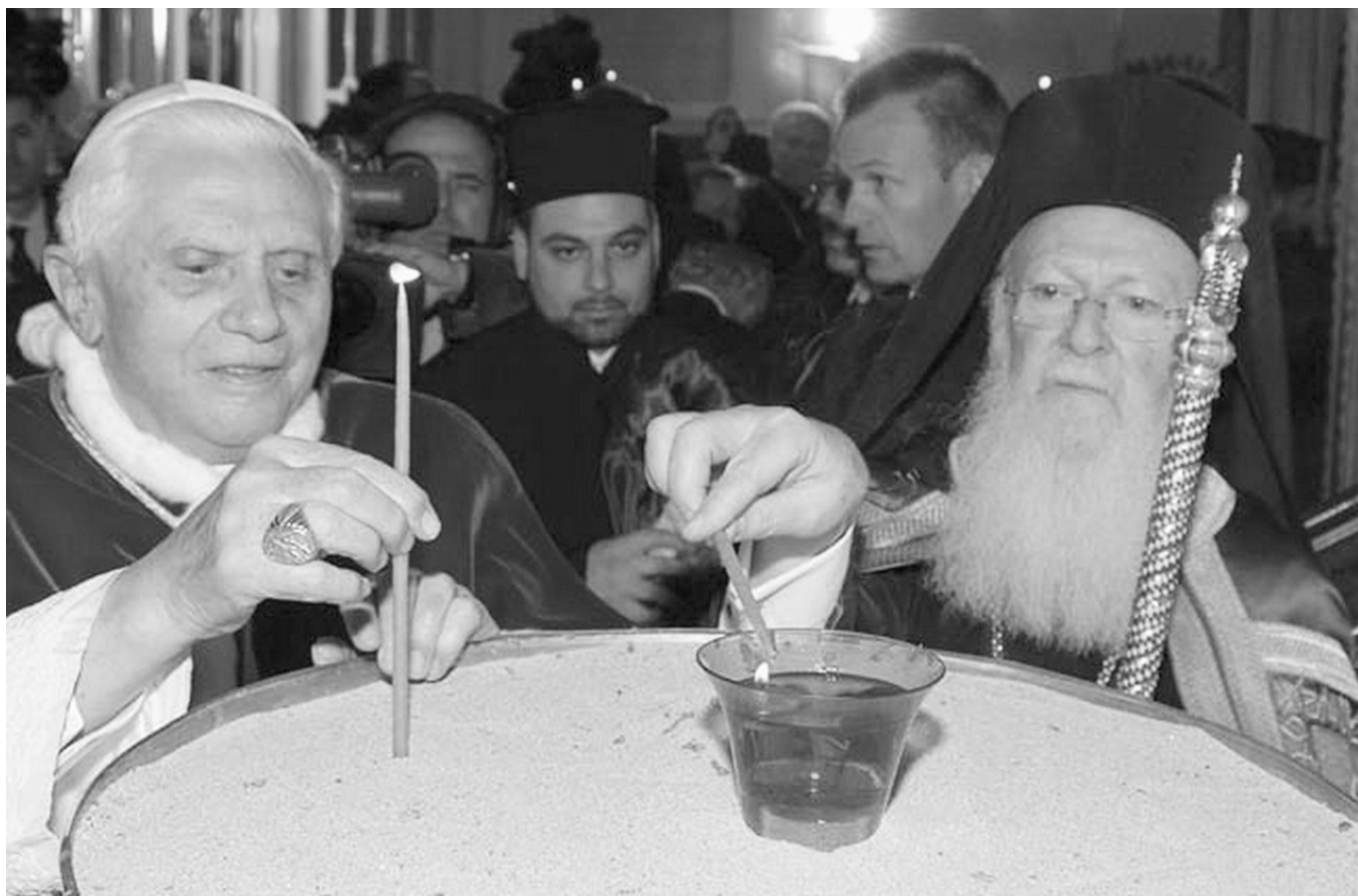
Stretnutie pápeža Benedikta XVI. s carihradským ortodoxným patriarchom Bartolomejom I. v roku 2006 v Istanbule

a kompaktné okolo svojich biskupov; nech teda každá pochybnosť a neistota je vylúčená. Nemýlil by sa ten, kto by v týchto slovách objavil odmietnutie takzvaného prozelytizmu, čo napokon bolo odmietnuté aj v Direktórii o ekumenizme (n. 46), kde sa uvádza, že treba sa usilovať odstrániť aj čo len zdanie takejto činnosti. Bez toho, aby sme vstupovali do problematiky prozelytizmu, na tomto mieste postačí uviesť, že – podľa našej mienky – pravoslávni biskupi sú nositeľmi konkrétneho a určeného úradu, majú veriacich, ktorých spravujú a vedú do nebeského kráľovstva a keď nadíde čas určený Božou prozreteľnosťou, dôjde aj k plnej jednote oboch cirkví. Z tohto dôvodu oni skutočne môžu vykonávať platne a dovolene cirkevnú jurisdikciu.