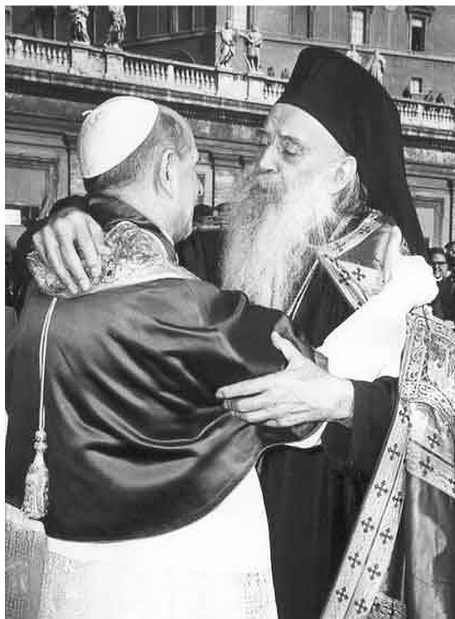
Stretnutie pápeža Pavla VI. s carihradským ortodoxným patriarchom Athenagorasom I. v roku 1967 v Ríme

Tu je dôležité rozpoznať, ako tento koncilový text bol bezprostredne vzťahovaný na problém, o ktorom práve píšeme. 19 Predovšetkým v dejinách bolo vždy isté, že pravoslávni biskupi prijímali a prijímajú biskupskú vysviacku vždy platne, a teda prostredníctvom prijatia vysviacky, prijímali a prijímajú aj trojitú úlohu, o ktorej hovorí koncilový text. Viac-menej pokojne sa prijímal aj fakt, že pravoslávni biskupi vykonávajú platne aj úlohu posväcovať, pretože táto úloha vyplýva z vysviacky ako sviatostná milosť. Dnes teda musíme to isté povedať aj o ďalších dvoch úlohách, pretože aj ony vyplývajú zo sviatostnej vysviacky. Takto sme dospeli k tomu, že jurisdikčné právne úkony pravoslávnych biskupov boli vykonávané platne z toho istého dôvodu, že platnosť týchto úkonov je spojená s mocou posväcovať a vyplýva tiež zo sviatostnej vysviacky. A hoci koncilový text uvádza, že spomínané tri úlohy „sa môžu vykonávať iba v hierarchickej jednote s Hlavou a členmi biskupského kolégia“, naše tvrdenie nie je v rozpore s týmto textom. Naopak ukazuje sa, že práve z neho vychádza ďalší argument v prospech nášho tvrdenia. Totiž v koncilovom texte sa hovorí o všetkých troch úlohách, potom ak pre úlohu posväcovať nejestvuje podmienka sine qua non pre jej platné vykonávanie, potom prečo by takáto podmienka mala existovať pre vykonávanie úlohy vyučovať a riadiť? Aj Nota explicativa praevia ho-